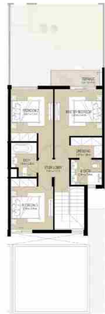
FIRST LEVEL الطابق الأول

3 غرف نوم + غرفة خادمة - الوحدة المتوسطة المساحة الكلية: 183.78 متر مربع / 1,978.2 قدم مربع