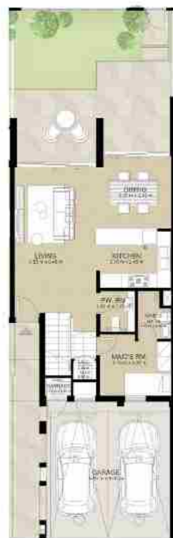
GROUND LEVEL الطابق الأرضي