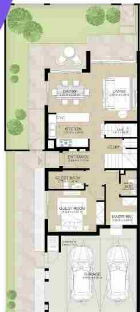
GROUND LEVEL الطابق الأرضي