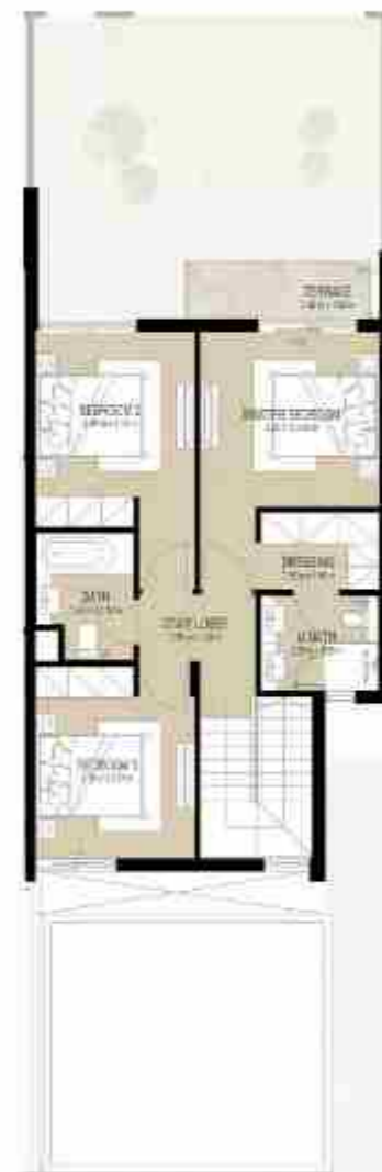
FIRST LEVEL الطابق الأول

3 غرف نوم + غرفة خادمة - الوحدة المتوسطة (مكسوة)