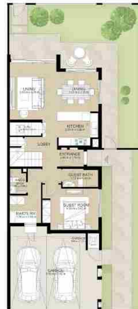
GROUND LEVEL الطابق الأرضي