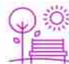
حديقة عامة Community Park