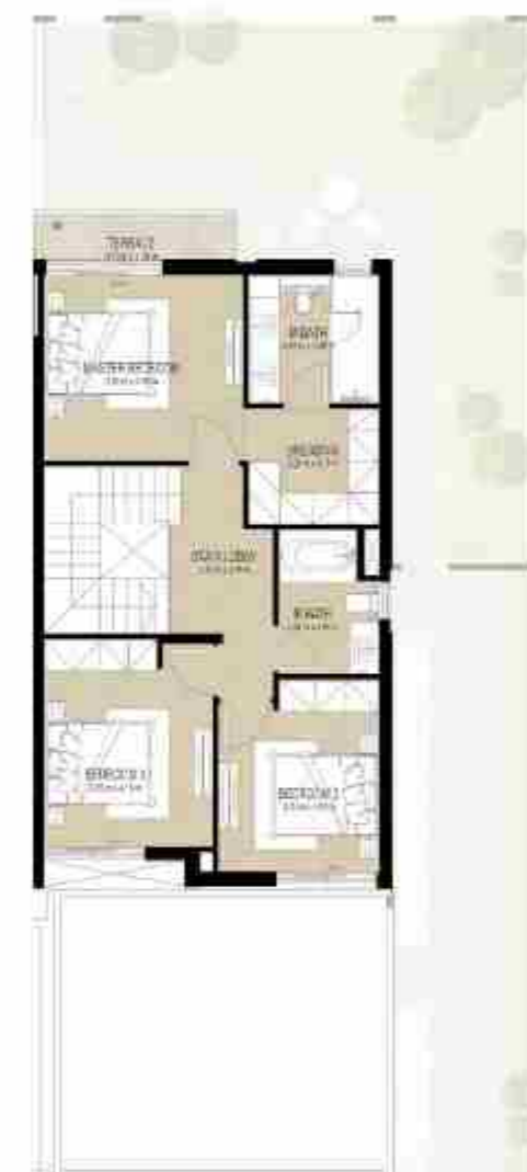
FIRST LEVEL الطابق الأول

4 غرف نوم + غرفة خادمة - الوحدة النهائية المساحة الكلية: 216.43 متر مربع / 2,329.65 قدم مربع