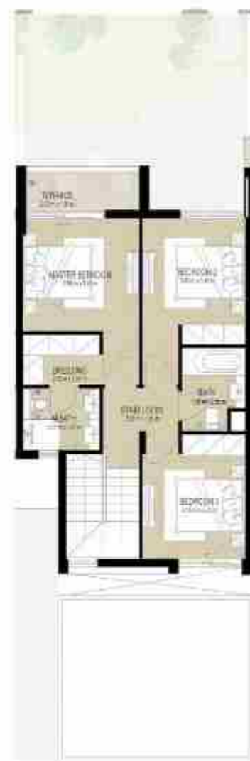
FIRST LEVEL الطابق الأول

3 غرف نوم + غرفة خادمة - الوحدة المتوسطة