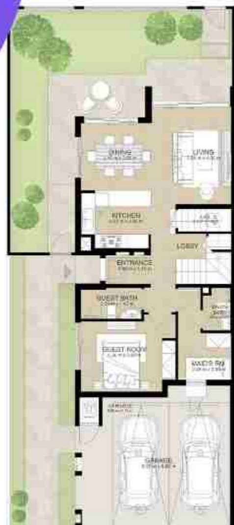
GROUND LEVEL الطابق الأرضي