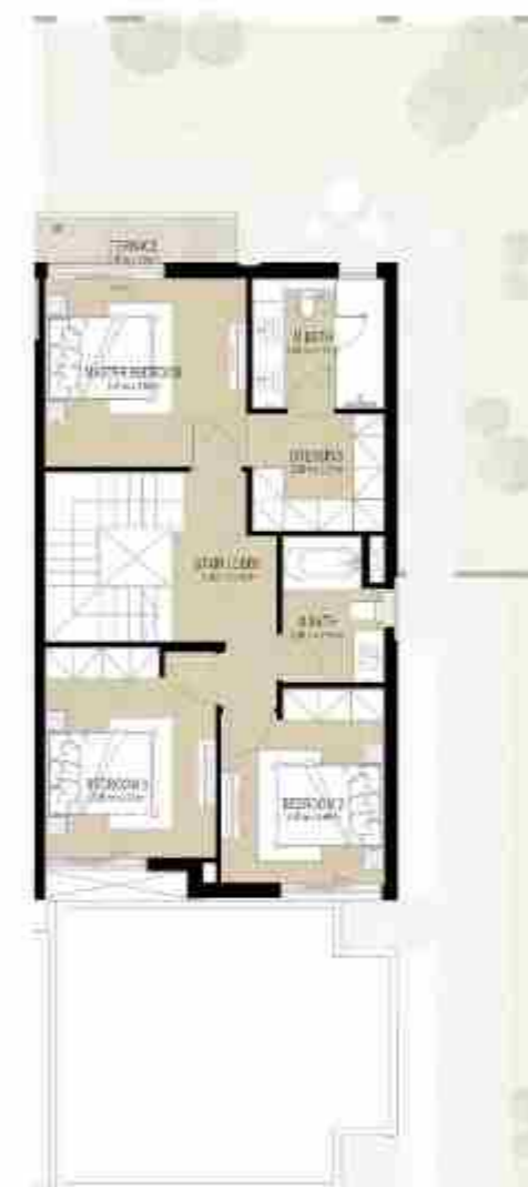
FIRST LEVEL الطابق الأول

4 غرف نوم + غرفة خادمة - الوحدة النهائية المساحة الكلية: 214.17 متر مربع / 2,305.32 قدم مربع