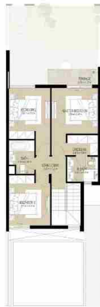
FIRST LEVEL الطابق الأول

3 غرف نوم + غرفة خادمة - الوحدة المتوسطة (مكسوة)