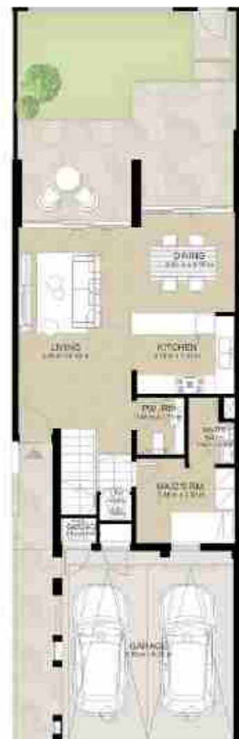
GROUND LEVEL الطابق الأرضي