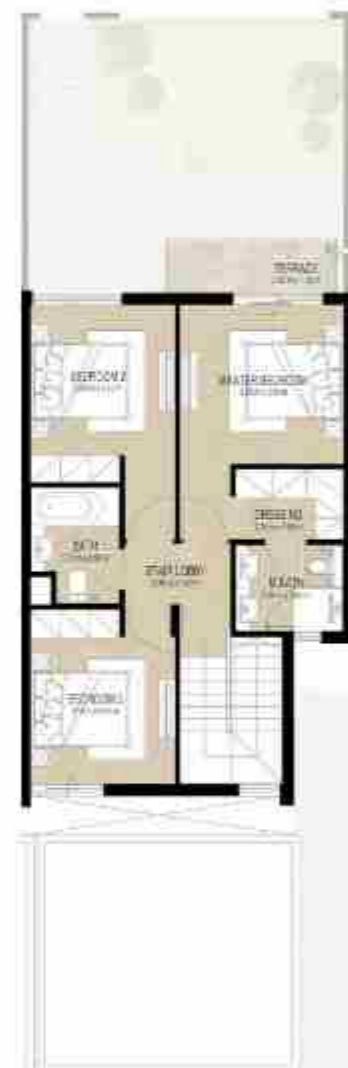
FIRST LEVEL الطابق الأول

3 غرف نوم + غرفة خادمة - الوحدة المتوسطة (مكشوفة)