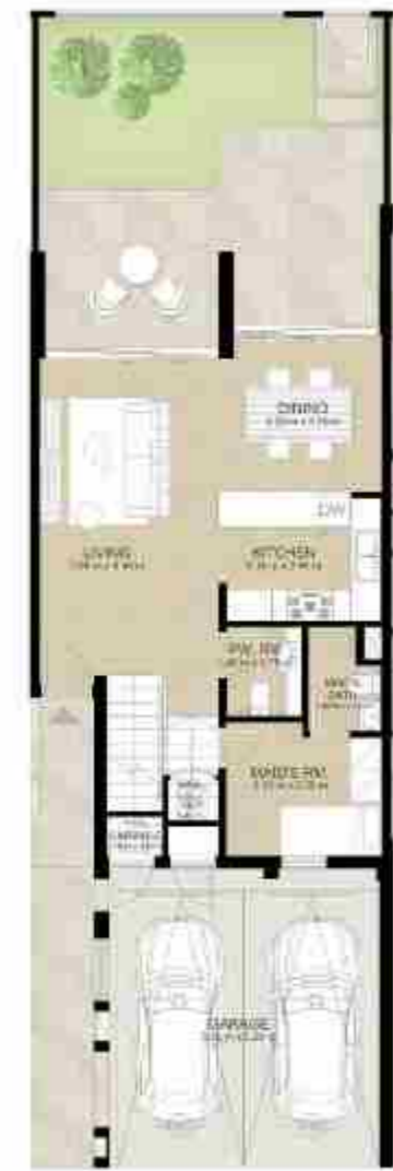
GROUND LEVEL الطابق الأرضي