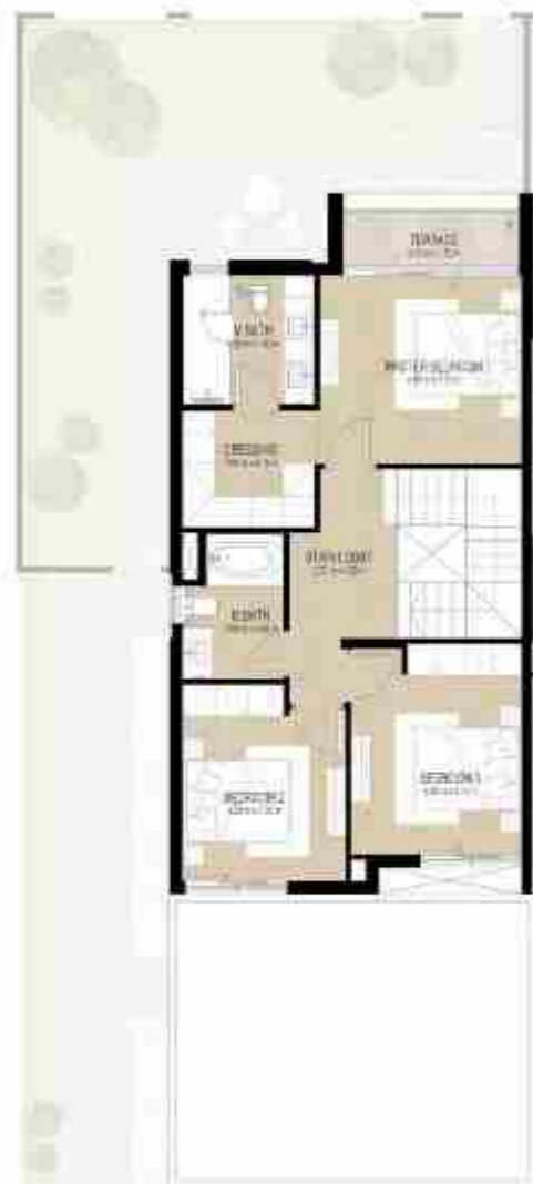
FIRST LEVEL الطابق الأول

4 غرف نوم + غرفة خادمة - الوحدة النهائية (مكسوة) المساحة الكلية: 216.27 متر مربع / 2,327.93 قدم مربع