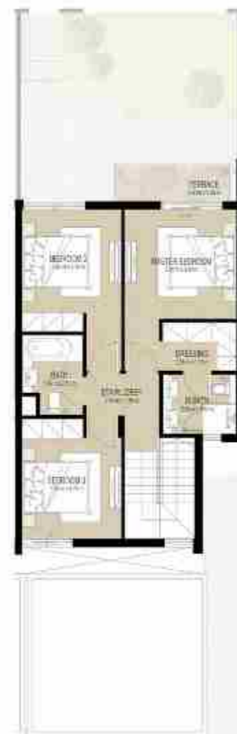
FIRST LEVEL الطابق الأول

3 غرف نوم + غرفة خادمة - الوحدة المتوسطة