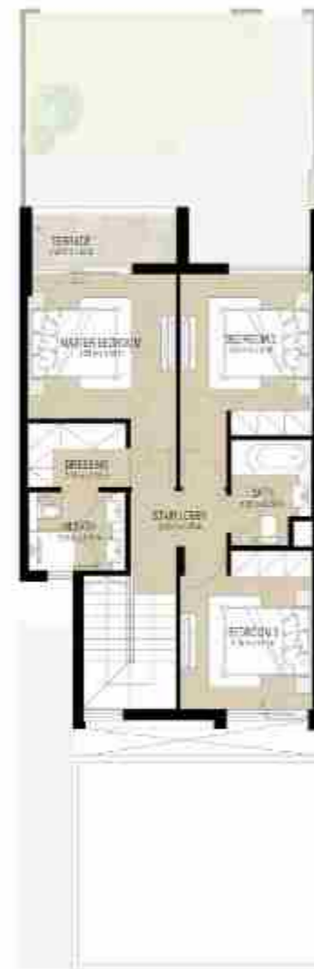
FIRST LEVEL الطابق الأول

3 غرف نوم + غرفة خادمة - الوحدة المتوسطة