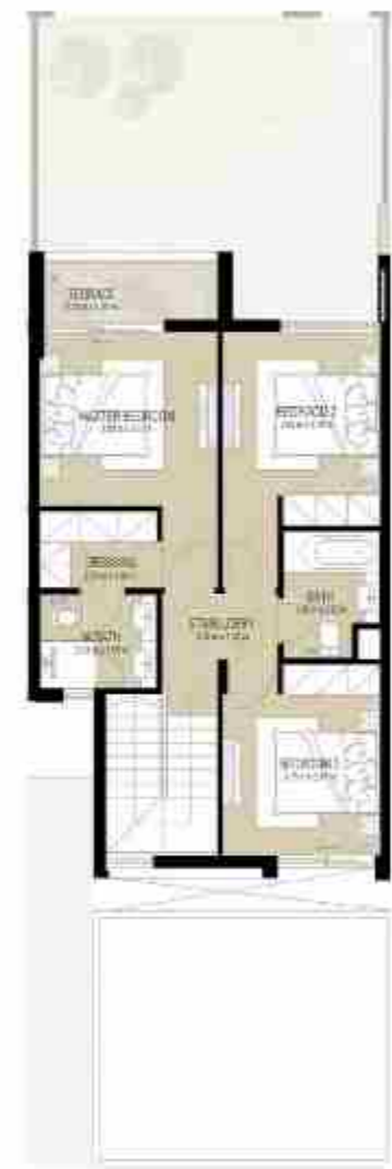
FIRST LEVEL الطابق الأول

3 غرف نوم + غرفة خادمة - الوحدة المتوسطة المساحة الكلية: 184.43 متر مربع / 1,985.2 قدم مربع 3-BEDROOM+MAID - MID UNIT TOTAL AREA: 184.43 SQM / 1,985.2 SQFT