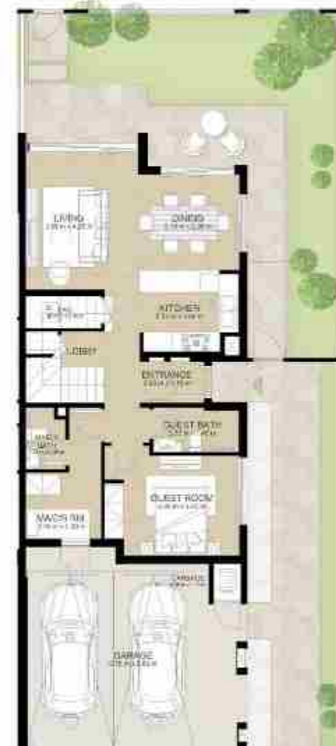
GROUND LEVEL الطابق الأرضي