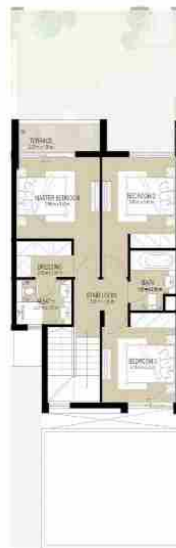
FIRST LEVEL الطابق الأول

3 غرف نوم + غرفة خادمة - الوحدة المتوسطة