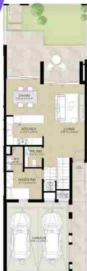
GROUND LEVEL الطابق الأرضي