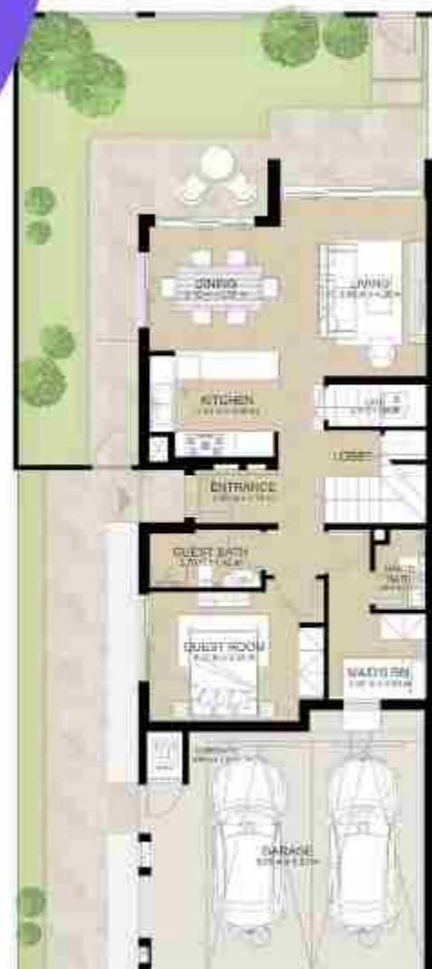
GROUND LEVEL الطابق الأرضي