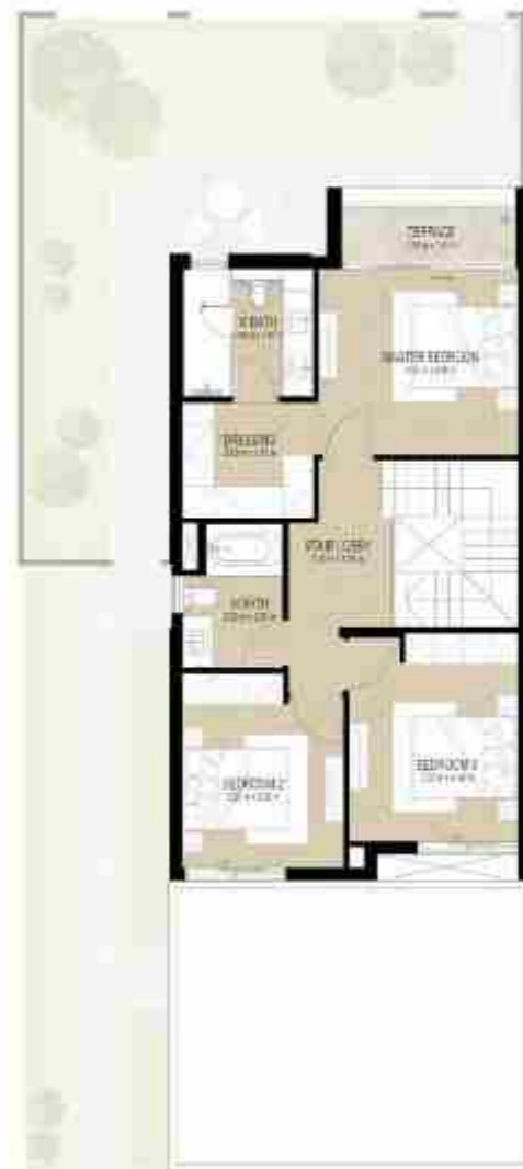
FIRST LEVEL الطابق الأول

4 غرف نوم + غرفة خادمة - الوحدة النهائية (مكسوة) المساحة الكلية: 216.19 متر مربع / 2,327.07 قدم مربع