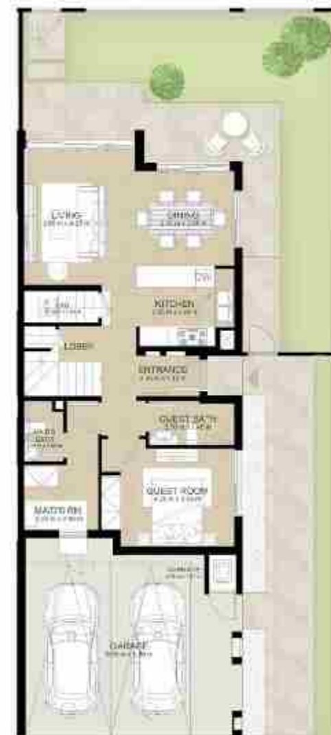
GROUND LEVEL الطابق الأرضي