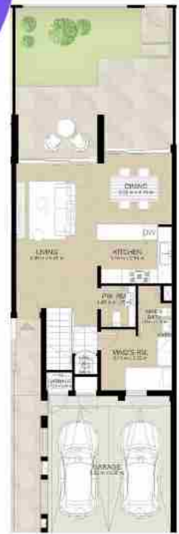
GROUND LEVEL الطابق الأرضي