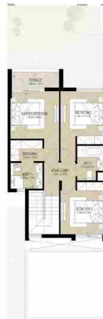
FIRST LEVEL الطابق الأول

3 غرف نوم + غرفة خادمة - الوحدة المتوسطة