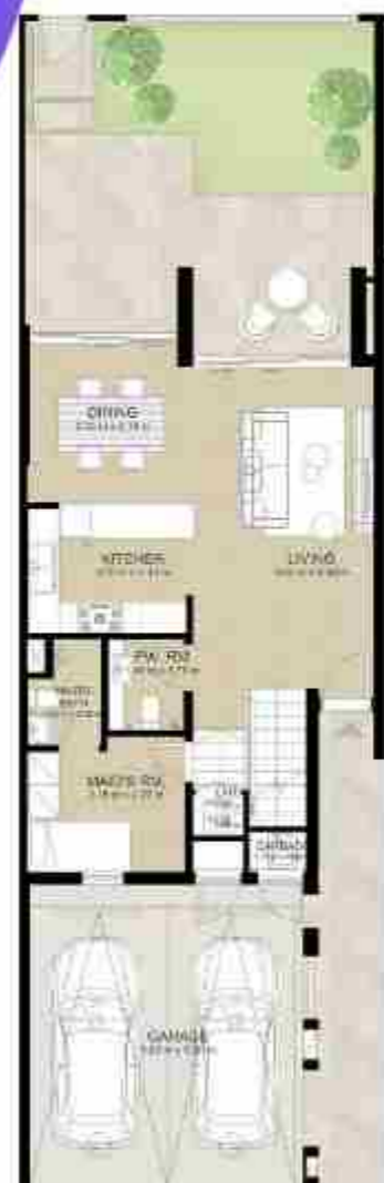
GROUND LEVEL الطابق الأرضي