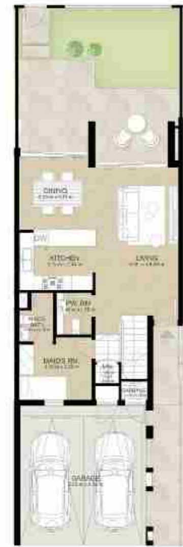
GROUND LEVEL الطابق الأرضي