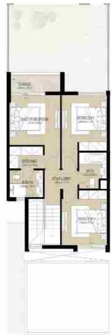
FIRST LEVEL الطابق الأول

3 غرف نوم + غرفة خادمة - الوحدة المتوسطة (مكسوة) المساحة الكلية: 184.11 متر مربع / 1,981.76 قدم مربع