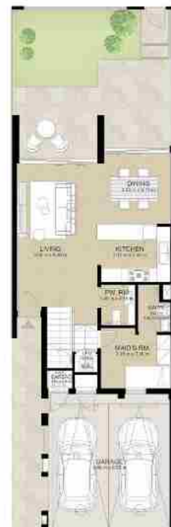
GROUND LEVEL الطابق الأرضي