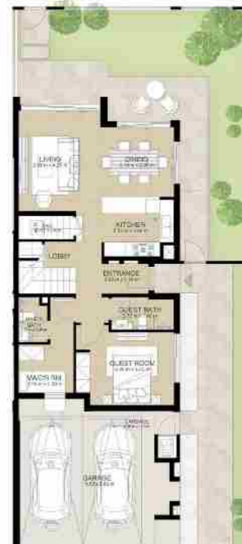
GROUND LEVEL الطابق الأرضي