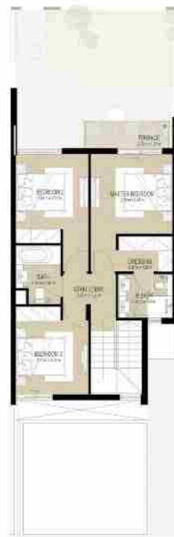
FIRST LEVEL الطابق الأول

3 غرف نوم + غرفة خادمة - الوحدة المتوسطة (مكسوة)