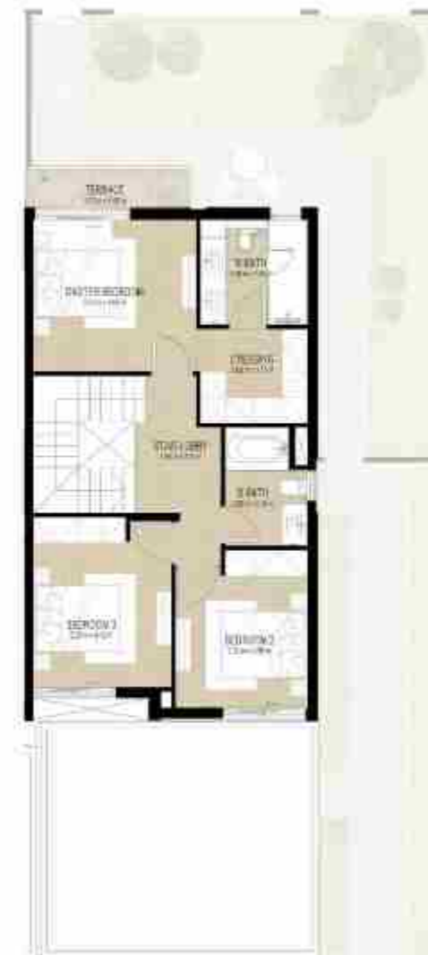
FIRST LEVEL الطابق الأول

4 غرف نوم + غرفة خادمة - الوحدة النهائية المساحة الكلية: 216.46 متر مربع / 2,329.98 قدم مربع