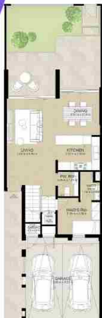
GROUND LEVEL الطابق الأرضي