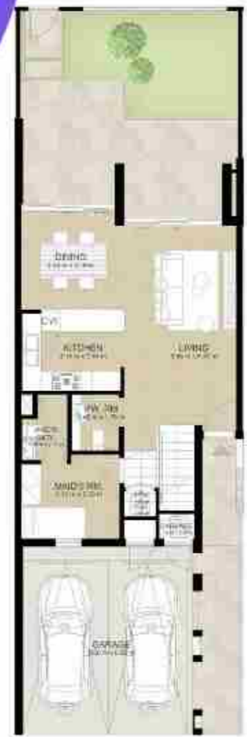
GROUND LEVEL الطابق الأرضي