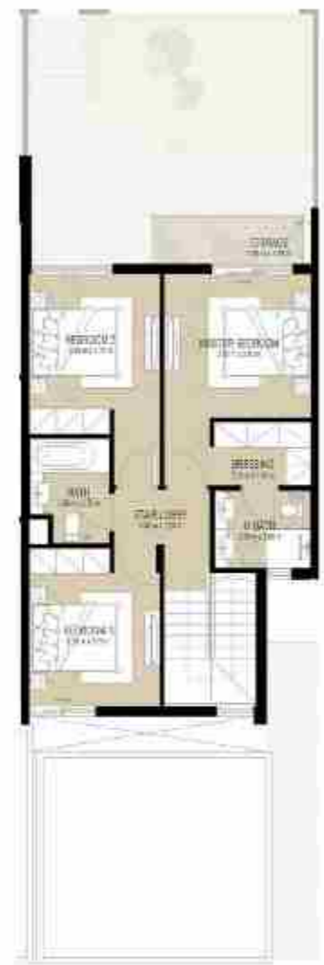
FIRST LEVEL الطابق الأول

3 غرف نوم + غرفة خادمة - الوحدة المتوسطة (مكسوة) المساحة الكلية: 184.54 متر مربع / 1,986.38 قدم مربع 3-BEDROOM+MAID - MID UNIT (MIRRORED) TOTAL AREA: 184.54 SQM / 1,986.38 SQFT