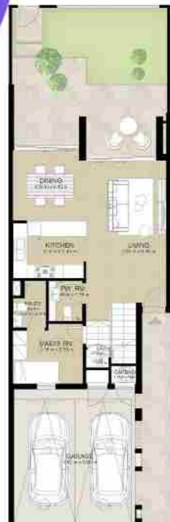
GROUND LEVEL الطابق الأرضي