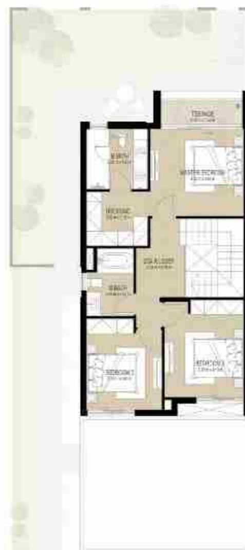
FIRST LEVEL الطابق الأول

4 غرف نوم + غرفة خادمة - الوحدة النهائية (مكسوة) المساحة الكلية: 216.24 متر مربع / 2,327.61 قدم مربع